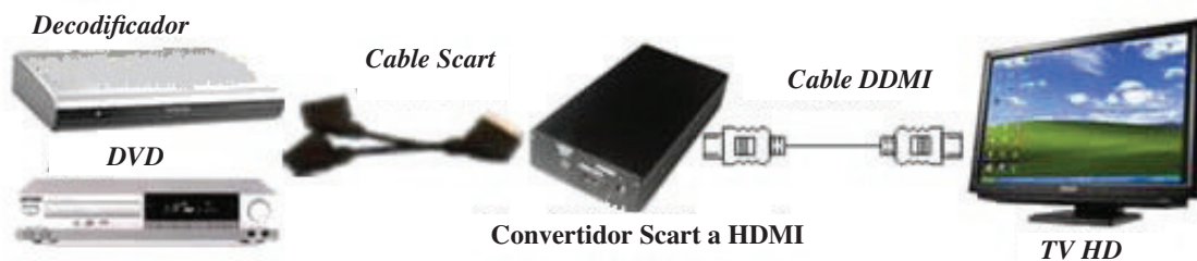
Diagrama de conexión:

Atención: Conecte / desconecte los cables con delicadeza.